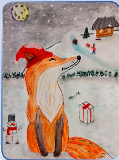
Прусакова Ксения (9 лет)

Говорят, под Новый год, что ни пожелается, все всегда произойдет, все всегда сбывается!